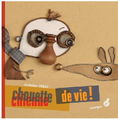
Chouette de vie, Christian Voltz, Edition du Rouergue (12,50€)

C'est l'histoire d'un personnage "simple" qui a une vie toute "simple"... enfin presque... car la vie n'est pas toujours aussi rose, qu'on le dit ! Métro, boulot, dodo. Non, vraiment, la vie n'est pas rose. Au boulot, il ne supporte plus les vociférations de son chef. Alors, il claque la porte. C'est comme ça qu'il croise sur sa route un pauvre chien paumé ... qui va donner un sens nouveau à sa vie. Comme toujours, Christian Voltz s'amuse avec les images bricolées d'objets récupérés. Quant au texte, c'est purement jubilatoire ! Tout est écrit avec des expressions imagées de noms d'animaux (tête de mule, sac à puces, chienne de vie, gai comme un pinson...). C'est le festival des inventions et des chouettes trouvailles.